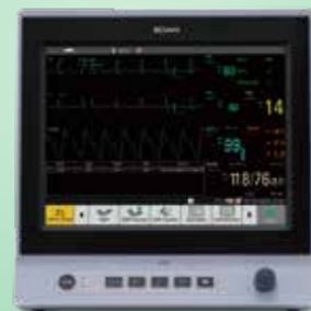
X series Монитор Пациента